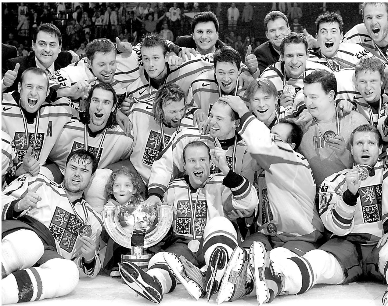
Чемпионы мира — чехи

Признавая, российская сборная на 69-м чемпионате также заслуживала игры в финале, однако кошмарное начало полуфинальной игры с Канадой перечеркнуло все надежды дружины Владимира Крикунова выиграть для России первую после 1993 года золотую медаль. При счете 0:4 уже на 22-й минуте матча против Канады отыграться практи-