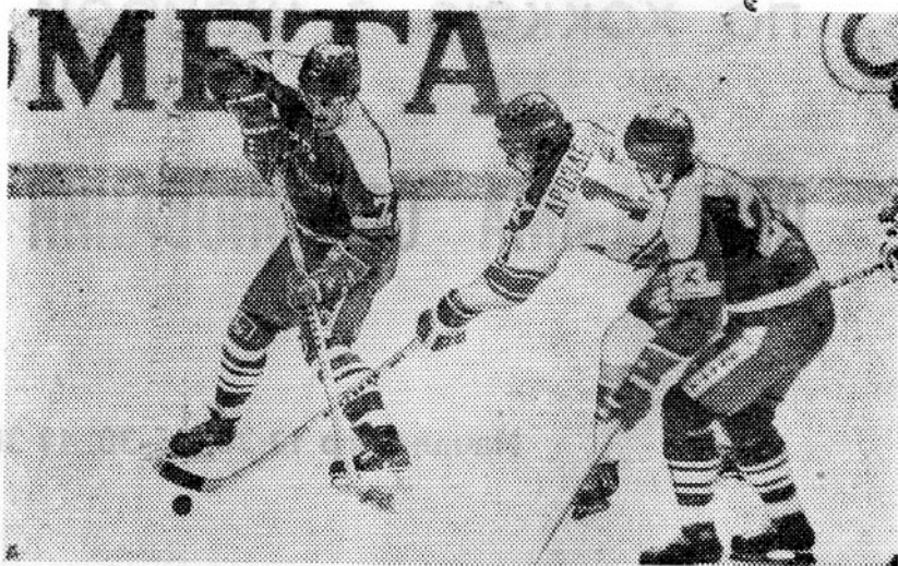
ЭТО — ХОККЕЙ!